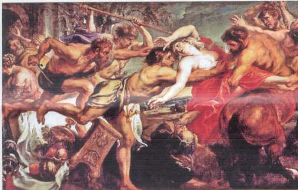
Het tumult waarin Hippodameia op de rug van Eurytion wordt getrokken. Pieter Paul Rubens schilderde dit doek (182 x 290 cm) tus-sen 1636 en 1638 voor Filips IV.

Op deze voorstu-die in olieverf op hout (groot 26 x 40 cm) van dezelfde voorstelling uit de Griekse mytholo-gie, zijn de details minder nauwkeurig maar de opzet wijkt weinig af van het latere doek.