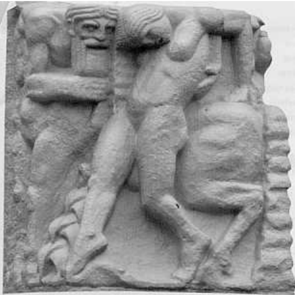
De centaur Eurytion drukt Hippodameia tegen zijn paardenlijf en voert haar met zich mee. Oorlogsmonument of eerbetoon aan de schilder Rubens? HENK THOMAS

Het beeldhouwde portret van Rubens is enigszins aange-tast, maar rechts is nog wel een figuur-tje (de schilder met palet in de hand?) te herkennen met ernaast een hoorn des overvloeds.