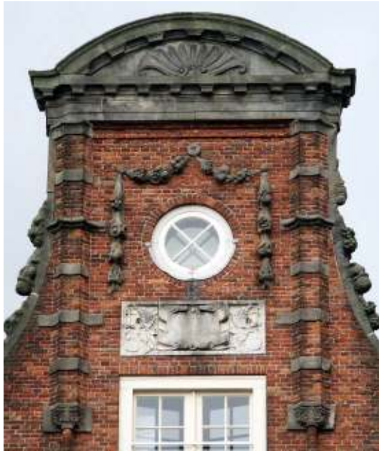
Diverse gevel ornamenten Gevel/gedenksteen, Vazen, Guierlandes