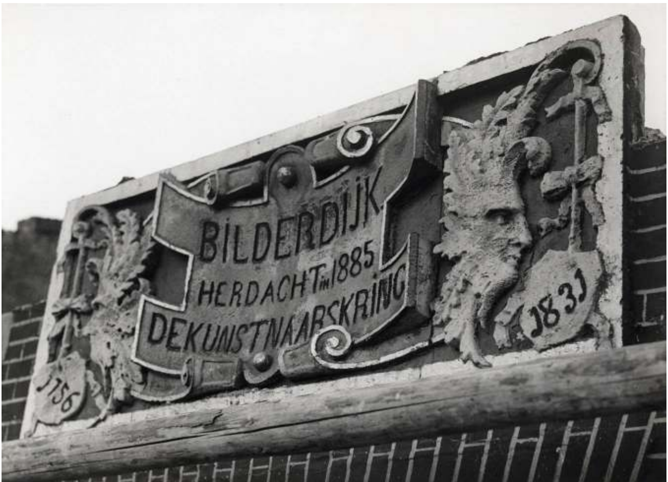
Foto tijdens de plaatsing van de Bilderdijksteen

De firma Snoep en Vermeer uit Amsterdam zou voor ons deze steen gaan restaureren met M70 Jahn zandsteen restauratie mortel krimparm. Tobias Snoep is gespecialiseerd in restauratie werken van natuursteen. Maar de steen is zover vergaan dat de Rijksdienst zelf zei het is beter deze te vernieuwen dan te restaureren want de restauratie zou het maar 20/25 jaar uithouden. Jammer maar de eigenaren waren niet eerder bereid de steen te laten restaureren. Nu zal er een replica van de steen worden gehakt in 2009.